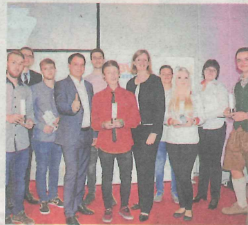
Die Lehrabschluss-Absolventen mit Auszeichnung